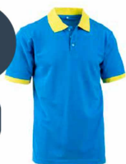
FOX MISERICORDIE E0404MS AZZURRO/GIALLO