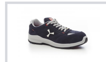
S0301 BLU NAVY