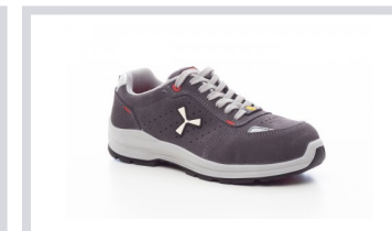
S1005 STEEL GREY