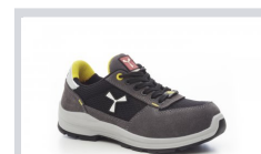
S0104 STEEL GREY/NERO