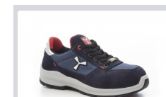
S0300 BLU NAVY/SEAPORT