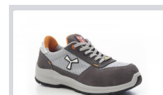
S1003 STEEL GREY/LIGHT GREY