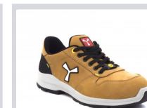
S0100 GIALLO ASPEN