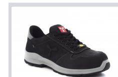
S0000 TOTAL BLACK