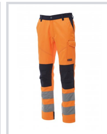
ARANCIONE FLUO/BLU NAVY